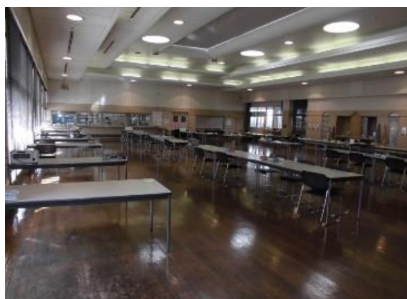
食事は食堂にて提供します

利用希望の方には事前の登録をお願いしていますので、まずはあけぼのにご相談ください。