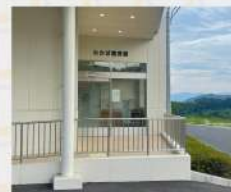
↑わかば療育園棟入口

わかば療育園棟前に10台ほどの駐車場がございます。満車の場合はリハセンター駐車場をご利用ください。